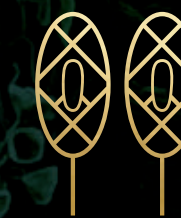
Canchas de Paddle