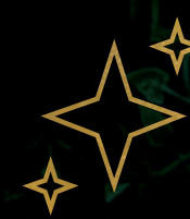
Mirador estelar (espacio para ver estrellas y fogata)