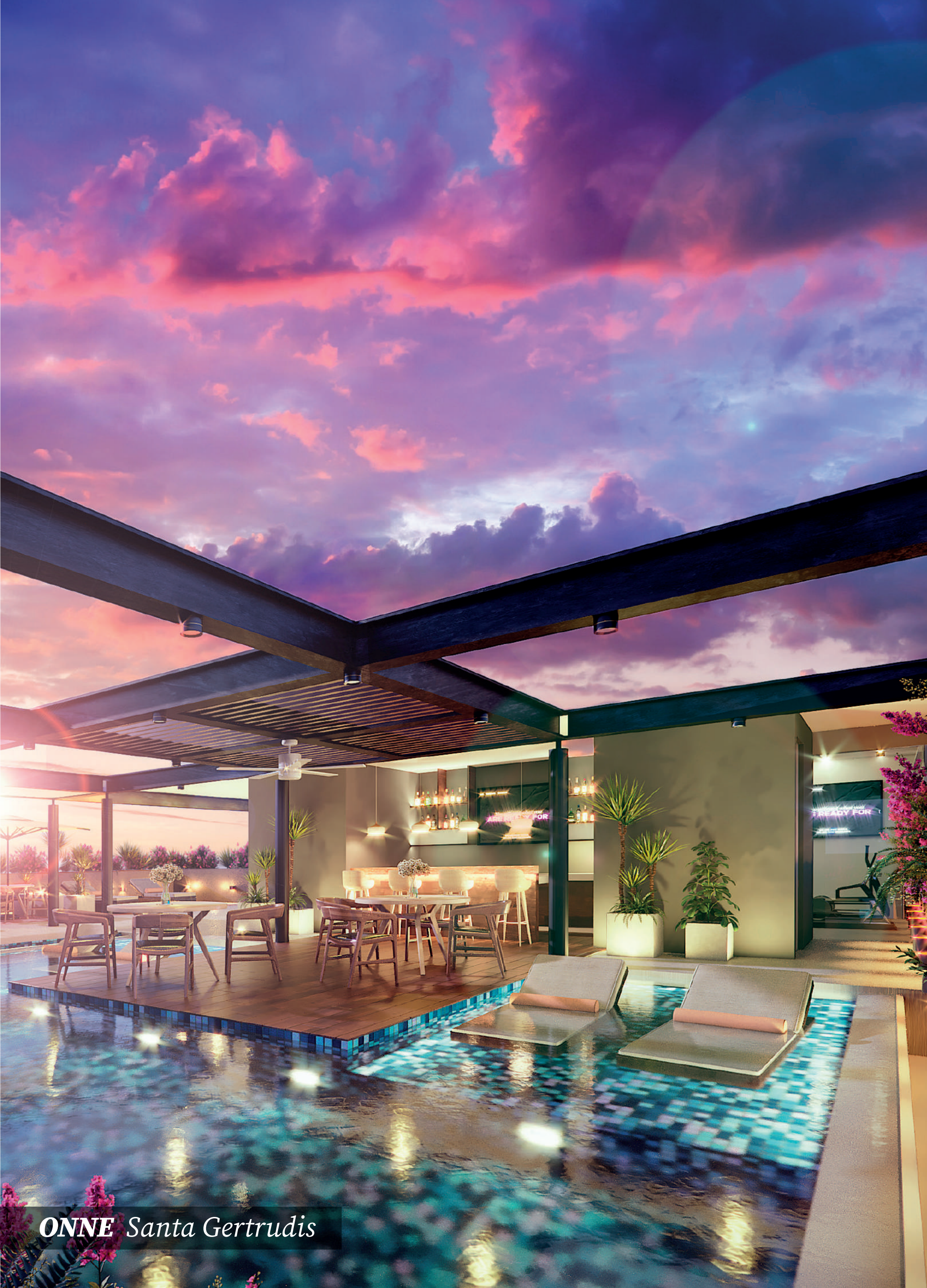
ONNE Santa Gertrudis