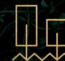
El jardín infinito