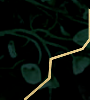
Circuito de jogging