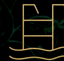
Alberca y canal de nado