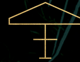
El Deck, El Pórtico y El Patio (Terrazas club)

Vive en un entorno totalmente planeado, donde la vida en comunidad y en familia serán los protagonistas, gracias a las distintas Terrazas club, parques, caminos interconectados con la naturaleza y la seguridad del desarrollo.